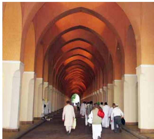
مدینه منوره - مسجد شجره